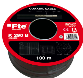
Bobina K 290 B