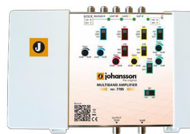
Ref. 7785 5 entradas: BI/FM, BIII/DAB, UHF1, UHF2, SAT