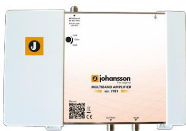
Ref. 7781 1 entrada: Cable