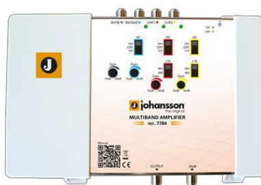
Ref. 7784 4 entradas: BI/FM, BIII/DAB, UHF1, UHF2